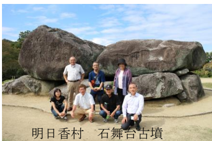
明日香村 石舞台古墳

1階の展示室には古墳からはぎ取った四神(白虎)の壁画と天井画(天文図)が展示されていて、本物を目のあたりにすることができた。その歴史的価値は解らないが、古の息吹を感じる事ができる。16時に研修の旅は終了、たくさんの思い出と共に一路大阪へと戻った。上村