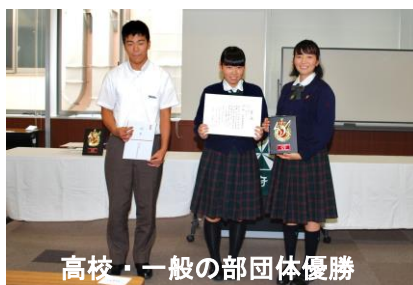
高校・一般の部団体優勝