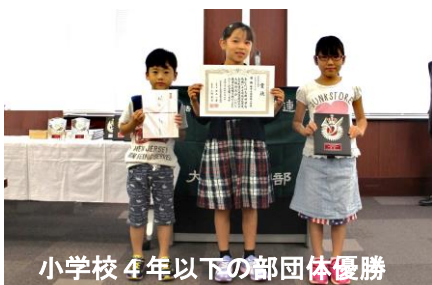
小学校 4 年以下の部団体優勝