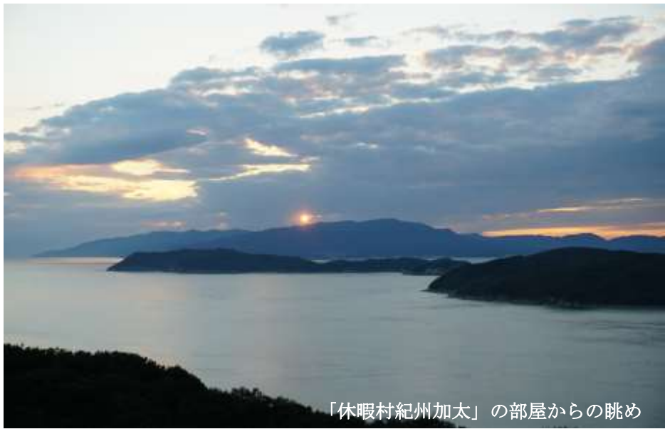
「休暇村紀州加太」の部屋からの眺め

うずとしてくるという魚釣りのメッカだが、今回は魚釣りではなく、新鮮な料理を堪能するというコースである。