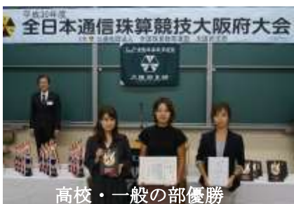
高校・一般の部優勝