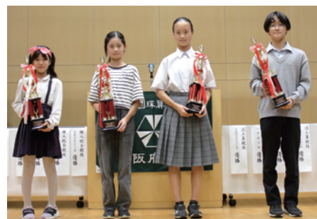
小学校4年以下の部