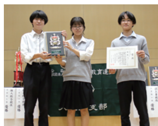
高等学校・一般の部