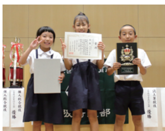
小学校4年生以下の部