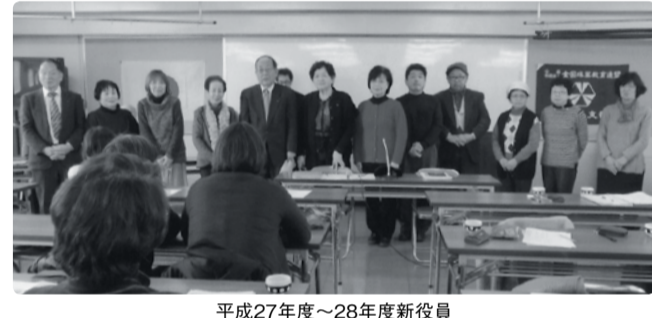
平成27年度~28年度新役員