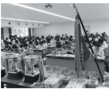
中国五県珠算選手権大会 開催日 平成二十七年八月二十三日(日) 於 広島県