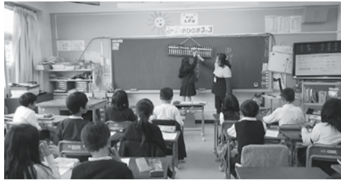
大そろばんも楽しいよ

しかし、毎年小学校ボランティア授業は、特定の者が多くの学校を受け持つ状態で、もっと改善が出来ないかと苦慮する面もありますが、その反面、一生懸命頑張っている学校側からは、また来て欲しいと思われるような授業をすれば、大変喜ばれ、珠算の普及活動には、たいへん役立ちそろばんのPRとして、社会貢献という意味においても、大いに寄与していると思います。