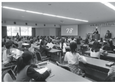
フラッシュ暗算に挑戦するちびっ子達

年々計算力も上がってきている。2年生以下は次回の大会に向け、3年生は高学年へ向かい更なる活躍を期待したい。